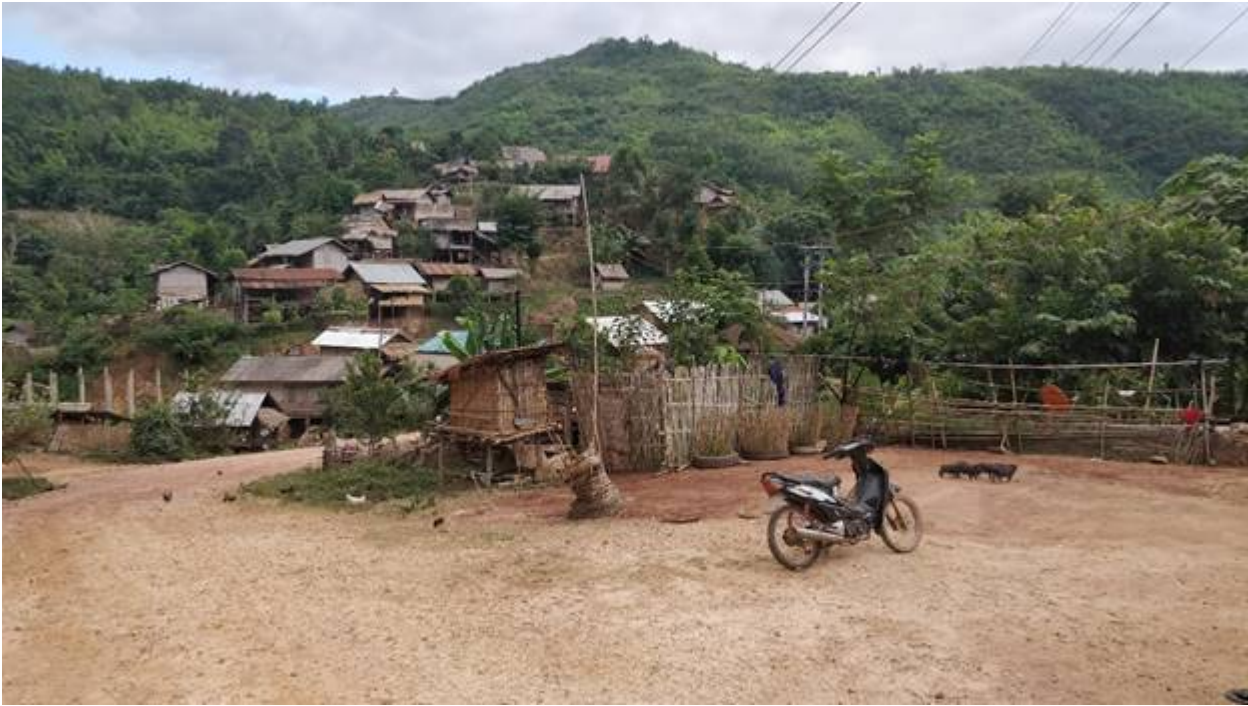
Kuva: kylä Luang Namthan läänissä, Laos