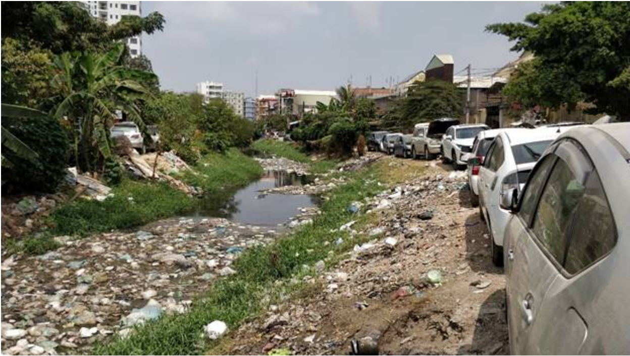
Kuva: jäte Phnom Penhissä

Vaikka tilanne on vakava, on Kambodzhassa onneksi järjestöjä, jotka aktiivisesti tekevät työtä suojellakseen ympäristöä ja luonnon varoja. Sainkin käydä marraskuussa tutustumassa yhteen järjestöön, joka työskentelee paikallisten yhteisöjen kanssa Etelä-Kambodzhnan mangrove-metsäalueiden suojelemiseksi. Tutkimme parhaillaan, yhteistyömahdollisuuksia tämän järjestön kanssa.