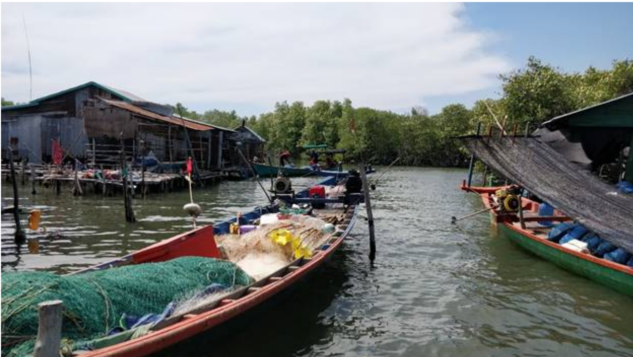
Kuva: mangrove-metsäalue etelä Kambodzhassa

Vaikka tilanne on vakava, on Kambodzhassa onneksi järjestöjä, jotka aktiivisesti tekevät työtä suojellakseen ympäristöä ja luonnon varoja. Sainkin käydä marraskuussa tutustumassa yhteen järjestöön, joka työskentelee paikallisten yhteisöjen kanssa Etelä-Kambodzhnan mangrove-metsäalueiden suojelemiseksi. Tutkimme parhaillaan, yhteistyömahdollisuuksia tämän järjestön kanssa.